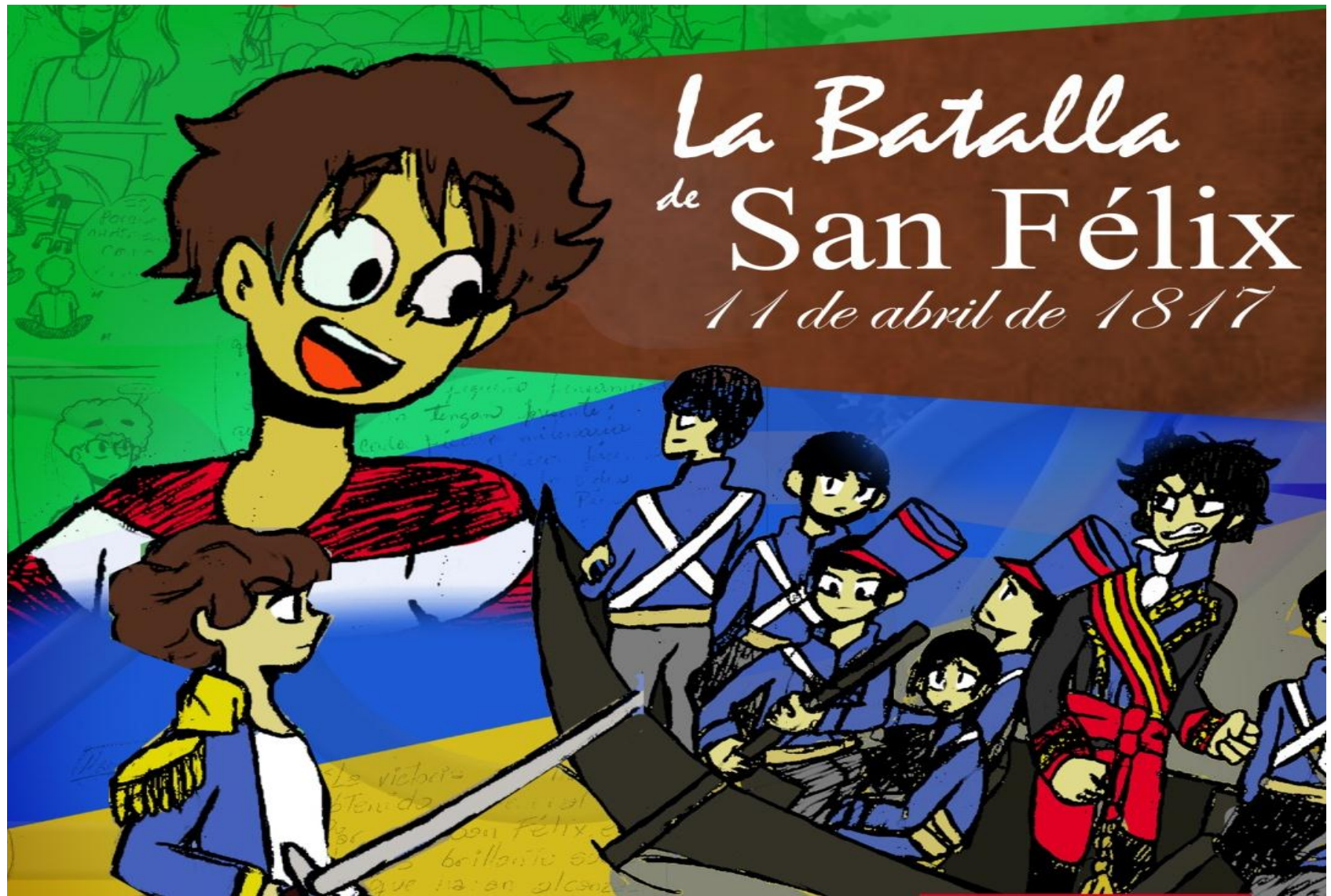
Ilustración de Adaluz Magallanes

'Programa: Historia, Identidad y Recreación desde Angostura del Orinoco